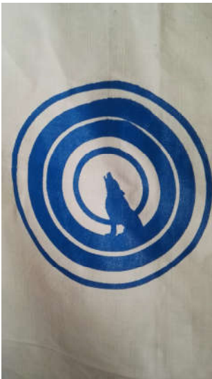
Nido del Lupo